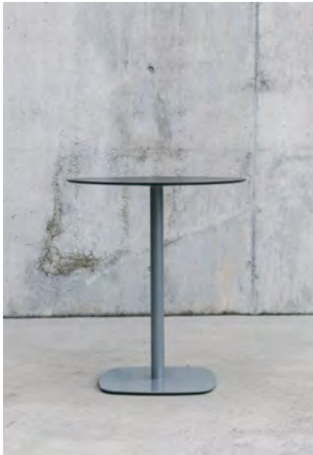
Lottus table (ref. 4912) lacquered in RAL 7004 and black HPL top.