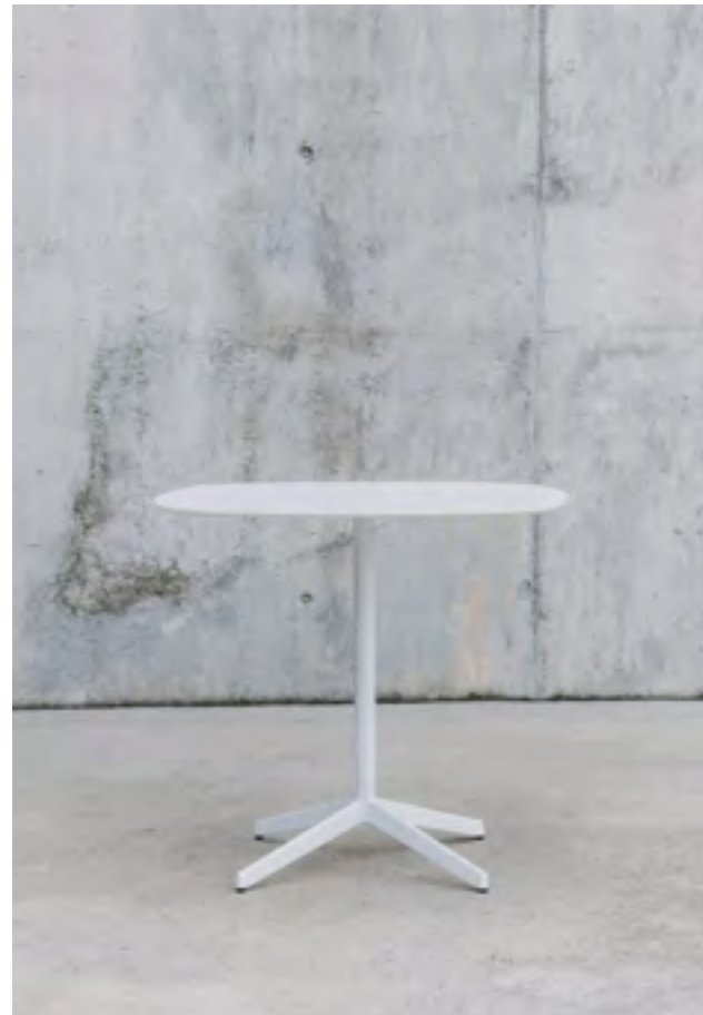
Lottus AL table (ref. 4947), lacquered in RAL 9016 and white Fenix top.

Lottus tables come in four height options: occasional, standard, café, bar. The post base has a choice of 12 paint colours, while the different sized and shaped tops are available in solid phenolic resin with veneer or laminate surface.