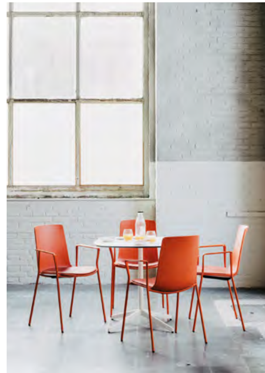
Lottus AL table (ref. 4947), lacquered structure in RAL 9016 and white HPL top. Lottus High (ref. 6200).